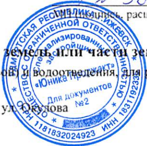
Схема предполагаемых к использованию земель или части земельного участка

Объект: Линейные сооружения канализации (в том числе ливневой) и водоотведения, для размещения которых не требуется разрешения на строительство